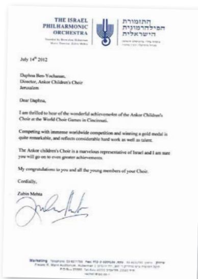
מכתבו של המאסטר זובין מהטה