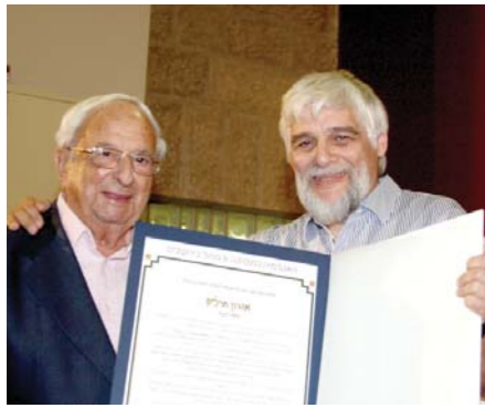
אהרון חרל"פ עם הנשיא החמישי, מר יצחק נבון