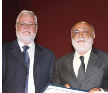
פרופ' יוסי ירושלמי עם פרופ' אילן שול