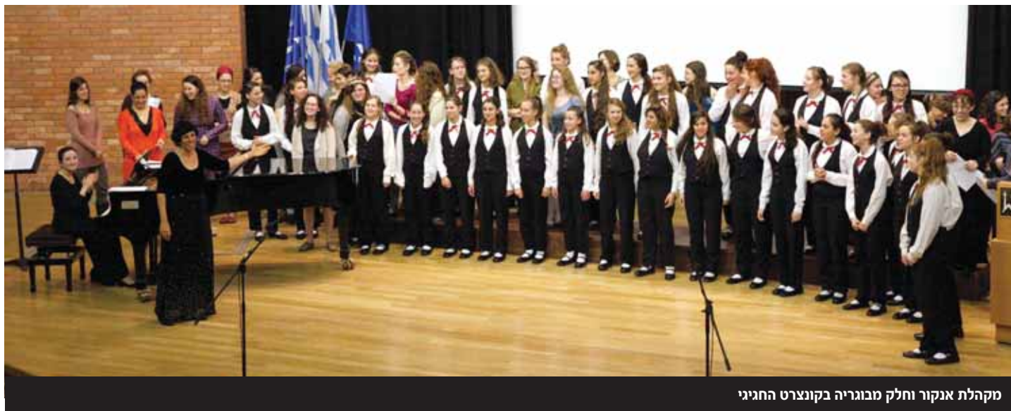
מקהלת אנקור וחלק מבוגריה בקונצרט החגיגי

שיודעים את הערך העצום שבשירה במקהלה - לימוד של דייקנות מהי, מצוינות, עמידה בלוח זמנים, אחריות, והכי חשוב - עזרה לזולת, שיתוף פעולה, האחד למען כולם וכולם למען האחד. בכך יצרנו משפחה גדולה שחוצה שנים. משפחה שבה החוט המקשר הוא המוסיקה והאהבה האדירה לעשייה המוסיקלית באשר היא.