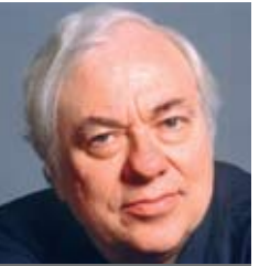
הפסנתרן ריצ'רד גוד, קונצרט חד פעמי בישראל

בערב ה-6 במרץ, מוצאי שבת, מקיים מרכז אולדוול של האקדמיה למוסיקה ביחד עם עמותת רובינשטיין, אירוע מיוחד, קונצרט חד פעמי, ראשון אי פעם בישראל של הפסנתרן ריצ'רד גוד. ריצ'רד גוד הוא מהפסנתרנים המובילים בדורו וללא ספק אחד הבולטים היום בעולם. גוד ידוע במיוחד בזכות האינטרפרטציות שלו ליצירות בטהובן, שוברט, שומן ובשנים האחרונות גם שופן, בך ודביסי. הוא הפסנתרן הראשון אי פעם שהקליט את כל הסונטות של בטהובן.