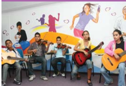
מרכז ווליום בפעולה; האקדמיה משדרת הפעילות המוסיקלית

האקדמיה למוסיקה ולמחול בירושלים השתלבה ב"מרכזי ווליום" בפריפריה יחד עם מורים ותלמידים מהאקדמיה מאפשרים לבני הנוער ללמוד ולהתפתח בעולם המוסיקה. במסגרת הפעילות הייחודית בפריפריה, מקיימות סלקום והאקדמיה שיתוף פעולה בו סטודנטים ואנשי סגל מהאקדמיה מלמדים נוער מהפריפריה נגינה ומוסיקה ומשדרגים בכך את הפעילות לרמה אקדמית.