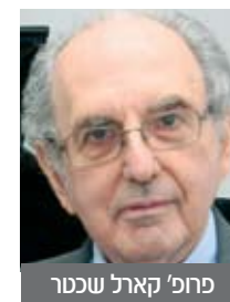
פרופ' קארל שצ'ר

מרכז אלדוול קיים סימפוזיון אקדמי ופסטיבל בינלאומי אותו פתח הפסנתרן הנודע מארי פרחיה