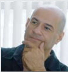
ד"ר ארי בן שבתאי

פרס אנגל ליצירה מוסיקלית מקורית לשנת 2009, הוענק למלחין ד"ר ארי בן-שבתאי.