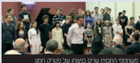
משתתפי התכנית שרים ביצאחו של פטרק חמנו