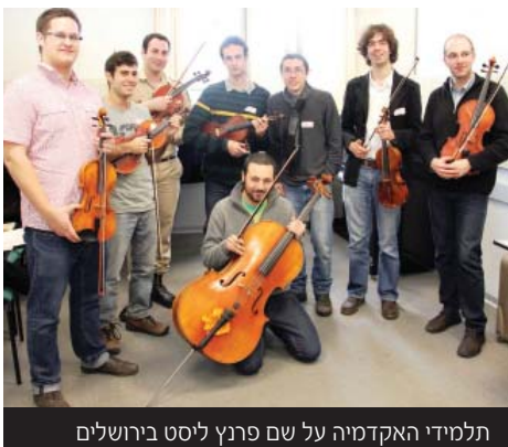
תלמידי האקדמיה על שם פרנץ ליסט בירושלים

המוביל. לסיום הפרויקט התקיים קונצרט ב"מרכז המוסיקה ירושלים משכנות שאננים". הקונצרט נערך בחסות: שגרירות ישראל בבודפשט, הונגריה, קרן מרק ריץ, האגודה למען החייל, וחברת חלאבין.